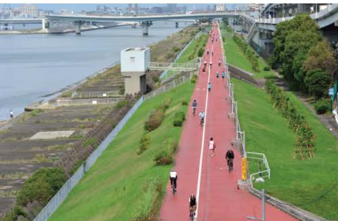
東京の荒川河口橋の上から荒川沿いのサイクリングロードを望む。休日にはサイクリングを楽しむ人でにぎわう)

駐輪場は今後どんどん進化し、機能アップしていくでしょうが、駐輪場にはこうした人と人との交流の場という要素があるんですね。それも忘れてはい