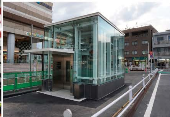
2019駐輪場グランプリ大賞に輝いた国分寺駅北口地下自転車駐車場。立地、機能、利便性、景観など総合的に最高の評価を得た