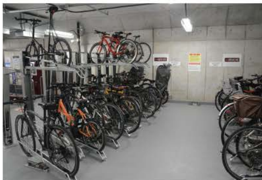
都市部では省スペースに有効な垂直昇降式2段式ラックの採用が増えている(写真は渋谷駅東口地下自転車駐輪場)

とで最善の方法を考え、実施していきたいですね。自転車と観光の親和性を考えれば各地方の観光協会などとの連携も必要になってくるのではないのでしょうか。私は横浜のみなとみらいに住んでいますが、自分自身が観光客になったつもりで周辺を散策するように