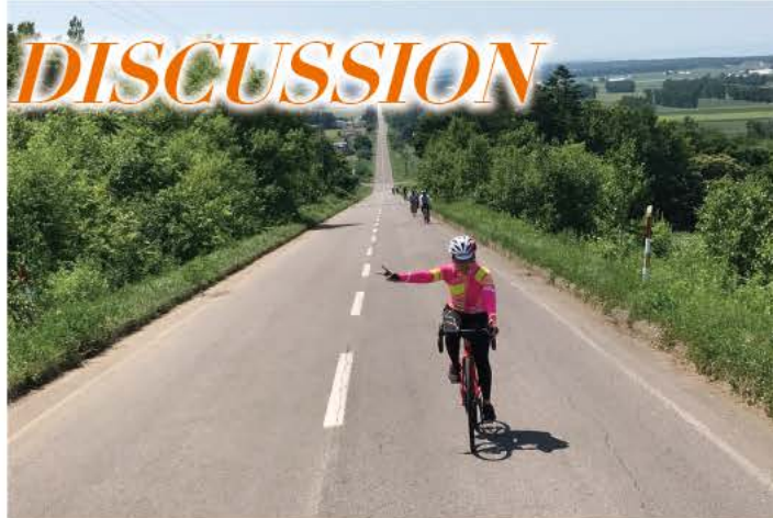
自転車の走行空間に恵まれる北海道はサイクリング天国と言えるだろう。夏場には多くのサイクリストが観光と走りを楽しんでいる

そういうことを考え合わせますと、駐輪場における情報発信機能は必要不可欠ではないでしょうか」