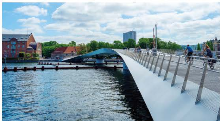
コペンハーゲン(デンマーク)の運河に架かる自転車・歩行者専用道路。自転車を重視したまちづくりが展開されていることを端的に示す写真だ

ではなく、これを一体化して考えるという方向性が強まってくと思っています。人気の高い野球、サッカーなどのプロスポーツにしても観客の入場収入だけではなかなか経営的に難しいわけで、放映権であるとか付随的な収入要素をからませたビジネス展開を拡充していく必要があると言われています。そういったことを意識した場合、自転車などの参加型スポーツに対する注目度はさらに増していくはずですよ。