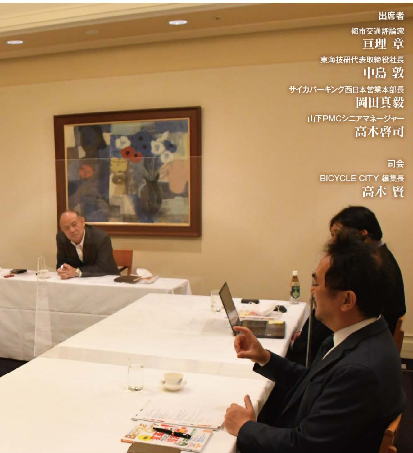
座談会では自転車ワールドの現状と今後の方向性について活発な討論が展開された