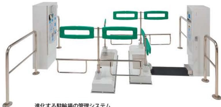
進化する駐輪場の管理システム (写真は東海技研が注力するBeAT、CyclunePediaの新システム。 QRコード決済、Felicaカードに対応し、利便性を強化している)