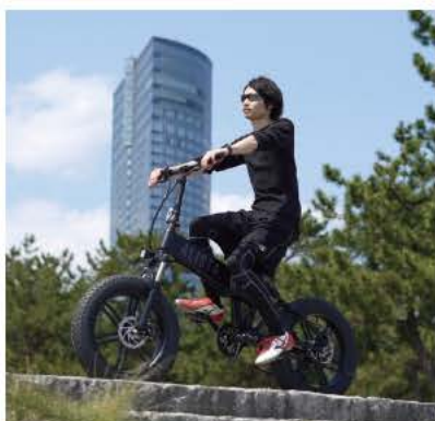
電動アシスト自転車の普及は順調に進んでいる。今後も右肩上がり販売台数が伸びていくことは間違いない