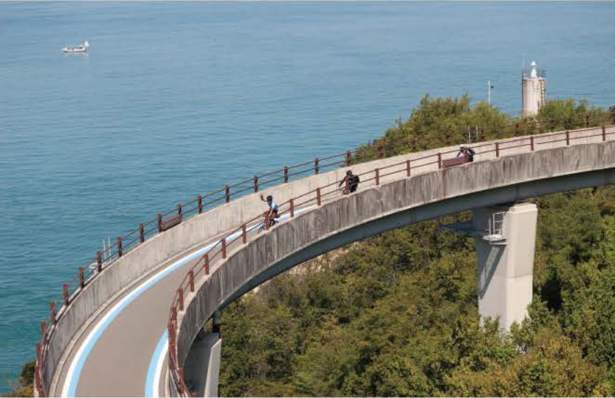
「しまなみ海道」はサイクリストを惹き付けてやまない

スポーツサイクルというのはやる人と観る人が一体化しているスポーツなので大きなポテンシャルを秘めているはず。自転車はスポーツビジネスのトップランナーになる要素を持っていると言えるのではないのでしょうか。駐輪場の有り様を探っていくにあたって、そういったことも視野に入れておくべきだと思います」